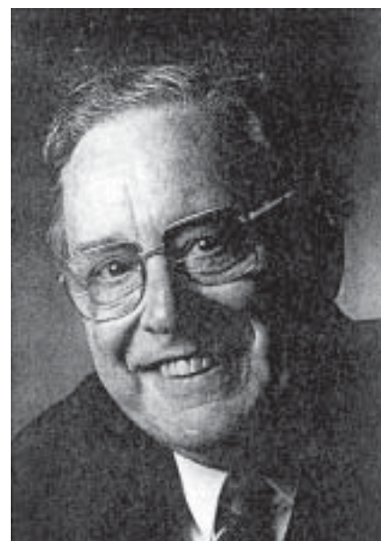
— 30. ledna 2004 převezmé Sir Charles Mackerras čestný doktorát JAMU

Nadace vydala Kalendárium akcí k tomuto roku, v němž je zaznamenáno na 70 různých programů od vědeckých konferencí (např. FF MU k literární opeře) přes koncerty, operní představení, výstavy. Jubilejní rok je rozdělen na dvě poloviny i obsahově: v lednu a začátkem února 2004 proběhne přehlídka operního díla – mimochodem, v úplnosti takto operní dílo zaznělo naposledy v r. 1958. Koncem září zahájený „Moravský podzim“ pak přinese Janáčkovy díla komorní a orchestrální. Avšak ani v mezidobí nezůstane Brno bez připomínek Janáčkovy díla. Na závěr operního festivalu