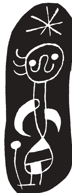
Pokračování na str. 12 — Kresba Joan Miró —

Protože existenční plocha scénické hry se obecně zužuje, považujeme za správné obohatit výuku filmovou tvorbou. Ateliér, který vzniká na Divadelní fakultě, stavíme vedle již vyučovaných oborů vědomě, protože komedie vždy stála především na hereckých individualitách: Burian, Voskovec–Werich, Sovák, Horníček, Zázvorková, Polívka, s tím, že ve většině případů se umění interpretační vázalo na určitou míru autorské tvorby. Ostatně jmenovaní se všichni uplatnili jak v divadelní, tak filmové tvorbě. Z celosvětového hlediska je možné tvrdit, že od vzniku filmu a první laviny němé grotesky sledujeme neuzavřený tok komedie, byť obohacené o zvuk a tedy slovo s větší či menší zástupností dodnes.