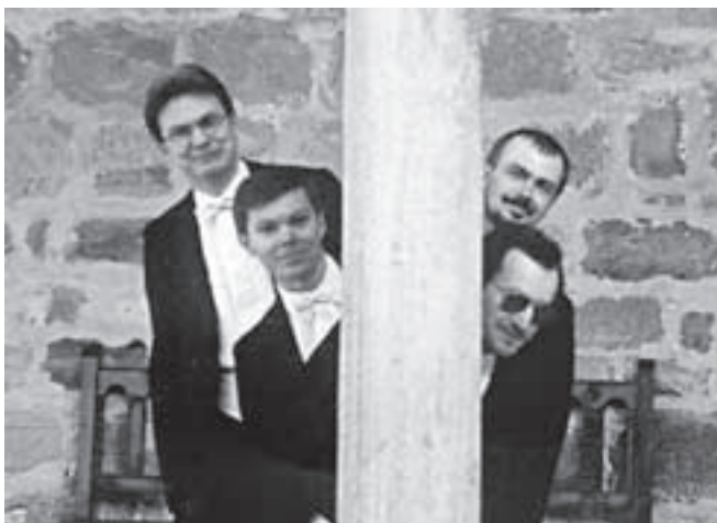
— Wallingerovo kvarteto —