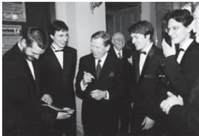
— Graffovo kvarteto hrálo Dr.h.c. Václavu Havlovi —