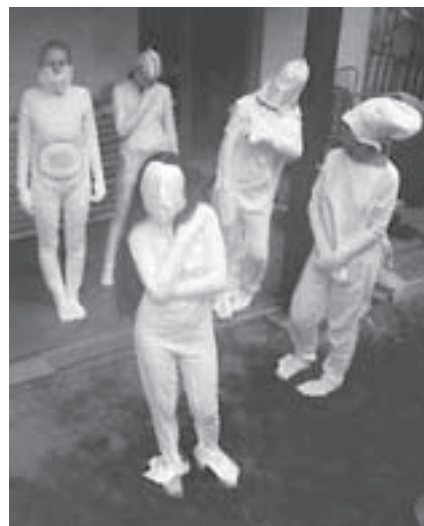
— Z kurzu tělového designu pro studenty scénografie (na snímku studie k zadání „Kůže toho druhého“)

Třetí část – scénický projekt Argos 5 rozezněl Martu vesmírnými zvuky, výbuchy fází a raket, umělým hlasem řídicího počítače a ukázal, kudy by se využití techniky a technologie nemělo ubírat. Lidé, napojení díky implantátům v mozcích na centrální řídicí počítač, ztratili nejen schopnost mluvit, ale i lidskost. Na takto rozvinutou techniku a technologii narazila