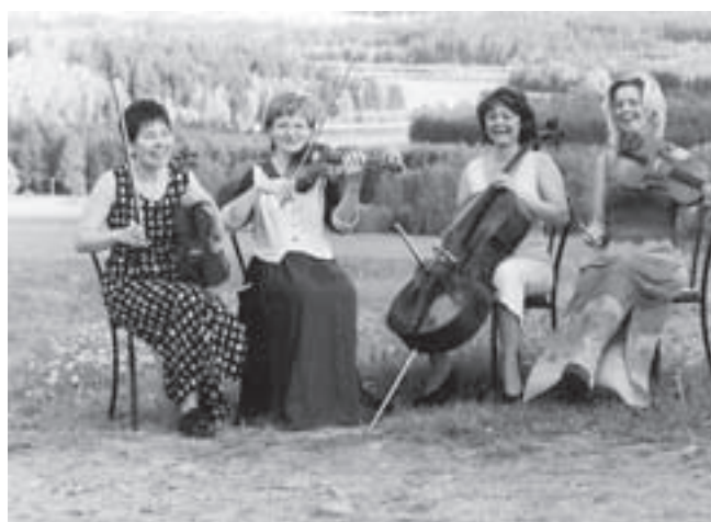
— Donna Quartet —