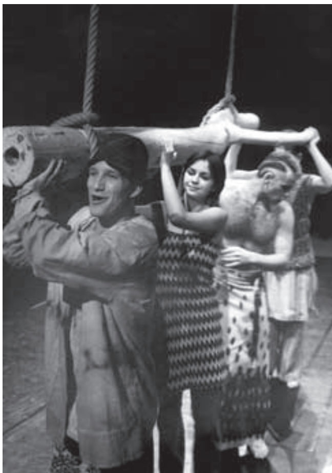
— Z inscenace Óz —

A poslední rok je ten tam. Rozběhli jsme se do světa a už teď vzpomínáme s lehkou melancholickým a smutným úsměvem na čas krásné společné práce. Na čas zvláště příjemné harmonie, tolerance, poznávání, hledání, lásky a přátelství. A tak jen znovu děkuji, děkuji, děkuji za ten zázrak, že tomu tak bylo.