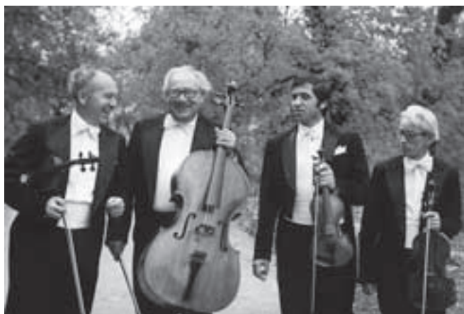
— Janáčkovci v plné síle —

Kubínovo kvarteto má velmi široký repertoár, který zahrnuje díla skladatelů všech slohových období od předklasicismu až po současnost. Kvarteto také spolupracuje s vynikajícími interprety domácími a zahraničními. Během svého působení vystoupilo na řadě významných festivalů doma i v zahraničí a koncertovalo téměř ve všech zemích Evropy.