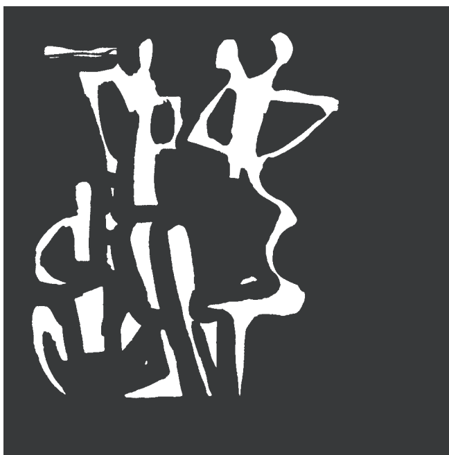
Kresba Libora Fáry

i záporných stránek, ale přesto si myslím, že nultý ročník dopadl úspěšně, a doufám, že se příští rok opět v tak hojném počtu při podobné akci sejdem. Pro všechny ty, kteří by se chtěli přípravou podobné akce v budoucnu zabývat, jsou k dispozici veškeré materiály a dokumenty vzešlé z realizace „černobílého“ tanečního večera na rektorátě JAMU.